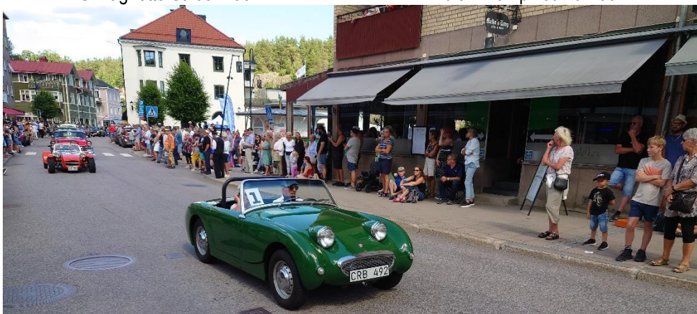
En Austin Healey Sprite från -59 som i folkmun kallas ”Frogeye”.