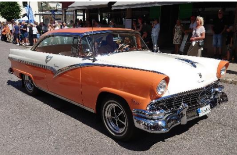
Ford Crown Victoria -56.