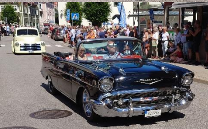
Till vänster: Chevrolet Bel Air -57.