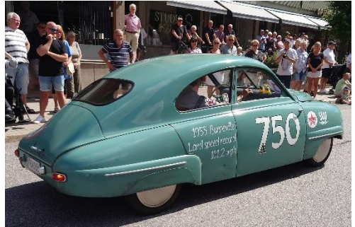
Saab 92B De Luxe -56.