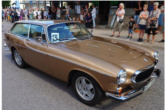
Volvo P 1800 ES från -72.