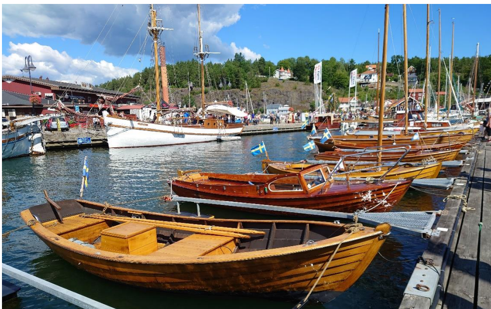
Foto: Vackra träbåtar i långa rader vid bryggan i Valdemarsviken.