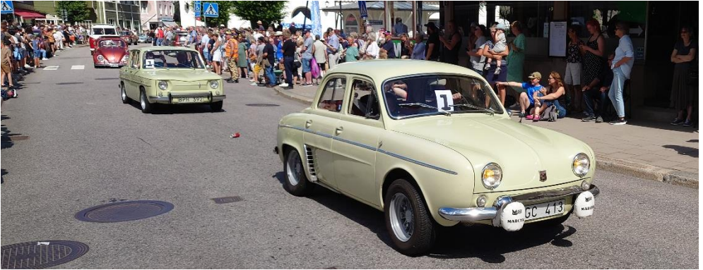
Två beigea Renaulter, en Daphne från -65 med en R8 från -63 i bakgrunden.