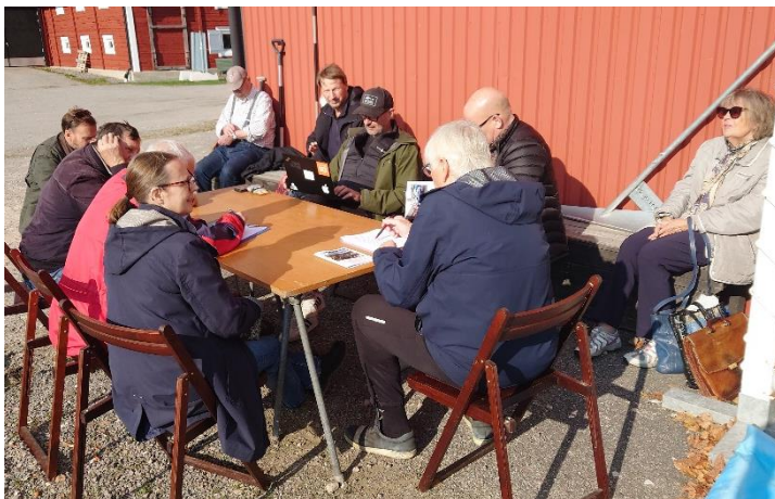
Bild: Styrelsen håller möte i bleka höstsolen.