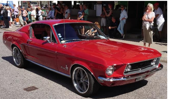
Ovan: Två kultbilar, en orange Corvette -71 och en Mustang -68.