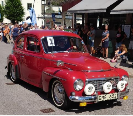
Volvo 544 PV från -64.