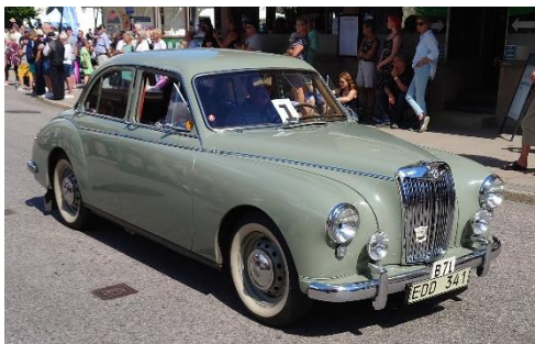
MG Magnette Saloon -58.

Bild vänster: Alfa Romeo Spyder 2.0 från 1985.