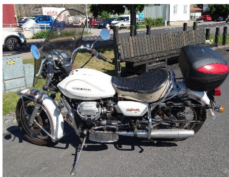
Moto Guzzi California II.