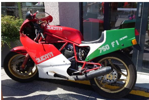
Ducati 750 F1.

Framme vid tvåhjulningarna såg vi långa rader av motorcyklar och mopeder, bland alla motorcyklar såg vi två fina italienska skönheter, med väldigt olika körstilar, en Ducati 750 F1 racer från mitten på 80-talet samt en Moto Guzzi California II från -87.