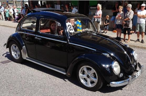
Volkswagen "bubbla" -61.