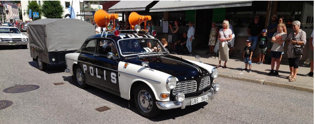
Volvo Amazon från -68 i Polisbilsutförande, med megafoner och släpkärra.