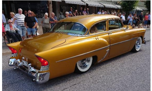
Kraftigt "customiserad" Chevrolet -54.

Detta var alltså ett litet axplock av alla de fantastiskt fina bilar som körde i kortege på Storgatan denna soliga lördagseftermiddag. Många av bilarna hade lokal förankring, de flesta övriga kom från en radie på cirka 10 mil. Det var väldigt roligt att se så många fina fordon. När kortegen var slut gick vi till en av Valdemarsviks alla restauranger för att få i oss lite mat. Till vardags känns det som det finns många matställen i Valdemarsvik, men denna dag räckte de knappast till, vi hade tur som fick ett bord på Myriams Veranda. De som kom lite senare fick vänta ganska länge på en plats.