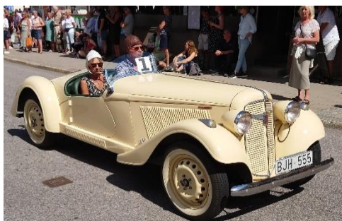
Adler Triumph Junior -39.