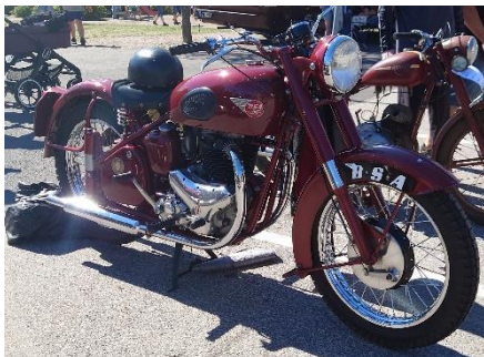
Bild: BSA A10 Golden Flash -53 till höger Husqvarna TV 110 -34.

Vi såg också dessa två fina motorcyklar, en vackert röd engelsk BSA från -53 samt en fin svensk Husqvarna 500 cc från -34 med Sturmeijer Archer motor som tillverkades i 150 exemplar på fabriken i Husqvarna. Dessa var dåtidens ”superbikes”.