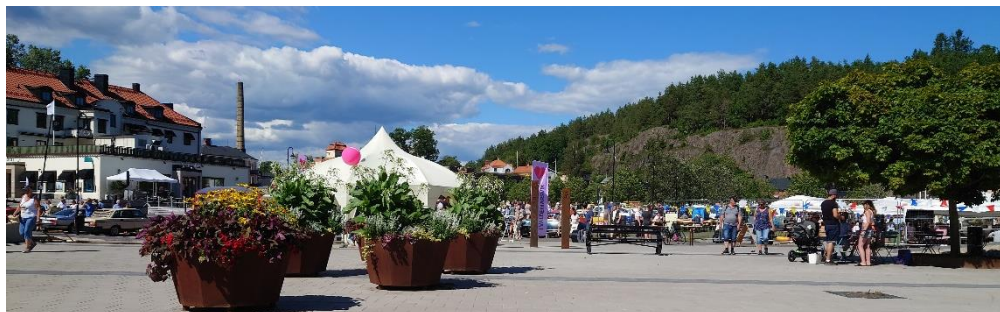
Vy över festivalområdet.

Denna båt "Miss Demeanor" är en replika av en GarWood Speedster. Dessa började tillverkas 1935 av Gar Wood, efter en beställning av Edward Noble. Han och några vänner beställde fem stycken båtar. Totalt byggdes 16 stycken. Den är 4,8 m lång och 1,5 m bred och väger 750 kg, motorn är en Mercruiser V6, 4,3 l, 220HP som gör 35 knop.