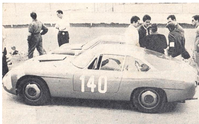
Flaminina Zagato med rörrens chassi.