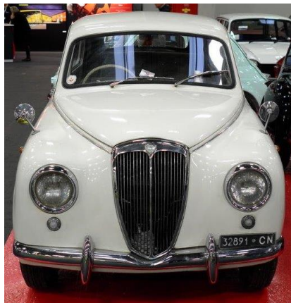
Astura cabriolet och Appia serie II.