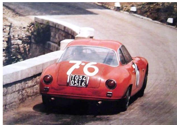
Privata förare tävlar också med den vanliga produktions Zagaton.