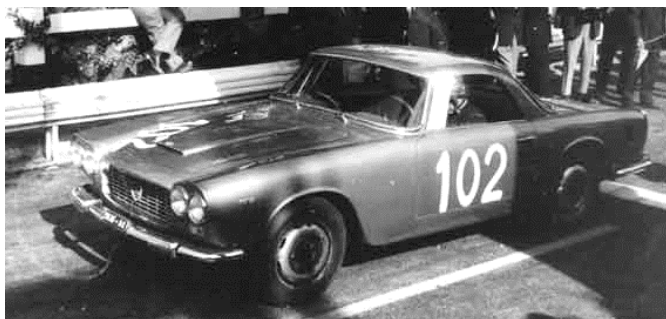
Targa Florio 1964

Lancia fabriken (eller HF Scudra Corse) tävlade aldrig officiellt med Flaminia med Touring kaross, privatförare tävlade en del även med dem: