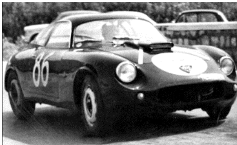
Två stycken Zagato tävlingsbilar, båda Targa Florio 1963.