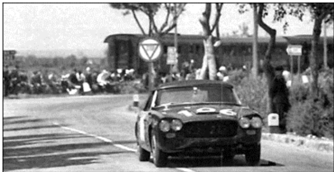
Till och med Touring Convertible tävlades det med.