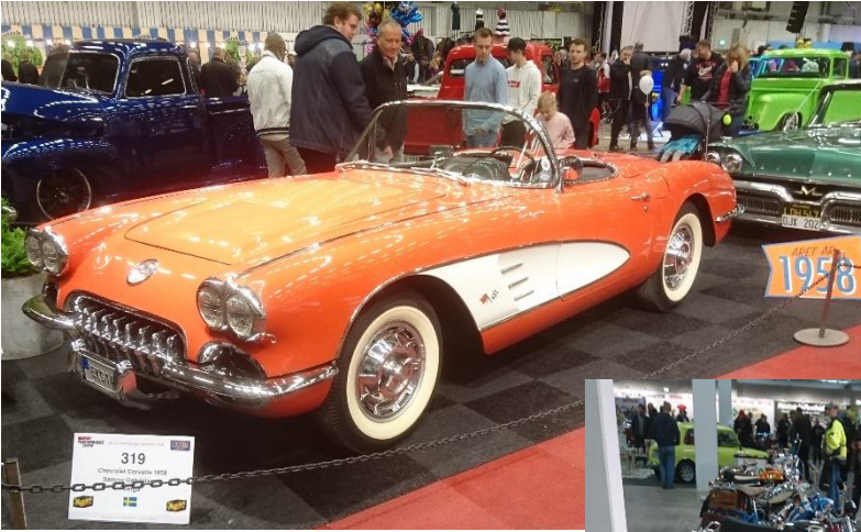
Här en vackert orangeröd Chevrolet Corvette från 1958.

Det fanns även många fina tvåhjulningar På mässan, både mopeder och motorcyklar.